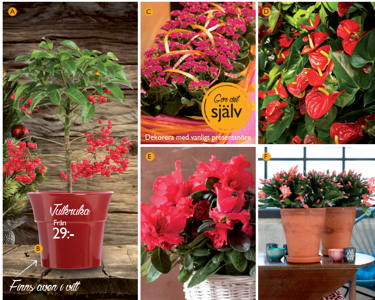
A. Ardisia 179:- • B. Julkruka fr. 29:- • C. Julglöd/Vinterglöd 29:- • D. Rosenkalla 129:- • E. Azalea 79:- • F. Julkaktus 59:-

Vad vore julen utan alla dess växter i sprakande röda julfärger?